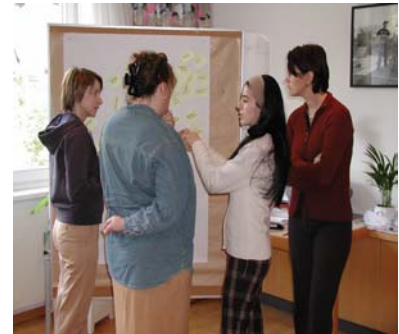
Evaluation im Lehrgang