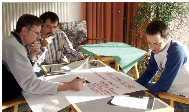
Gruppenarbeit im Lehrgang Bildungs- und Berufsberatung